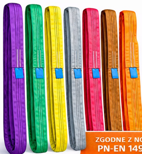
Tabela charakterystyki zawiesi wężowych